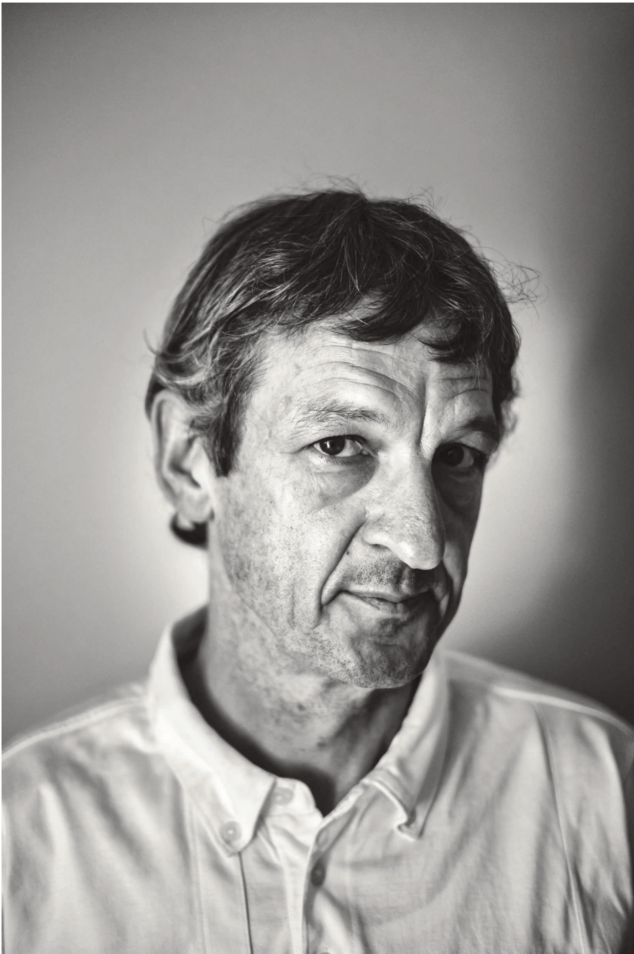
▶ Paul Verhaeghe: 'We hebben het beter dan in de negentiende of twintigste eeuw. Maar we hebben het minder goed dan in 2000. Dat baart me zorgen.'