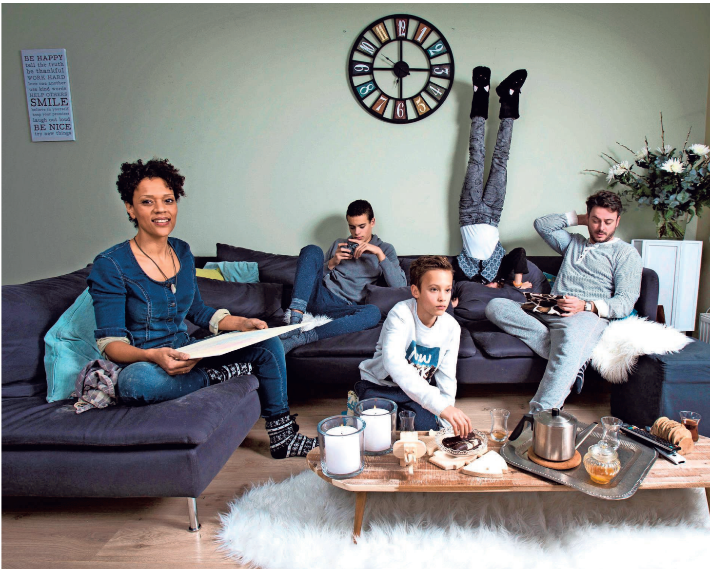
► Ouders voeden hun kinderen niet meer alleen op, stelt Verhaeghe. ‘Opvoeding is een taak van de ouders, maar evengoed van de groep.’

“Toch niet. Bij Orwell was Big Brother de incarnatie van de dictator. Autoriteit functioneert ten dele op basis van angst: hou je stil, of je gaat